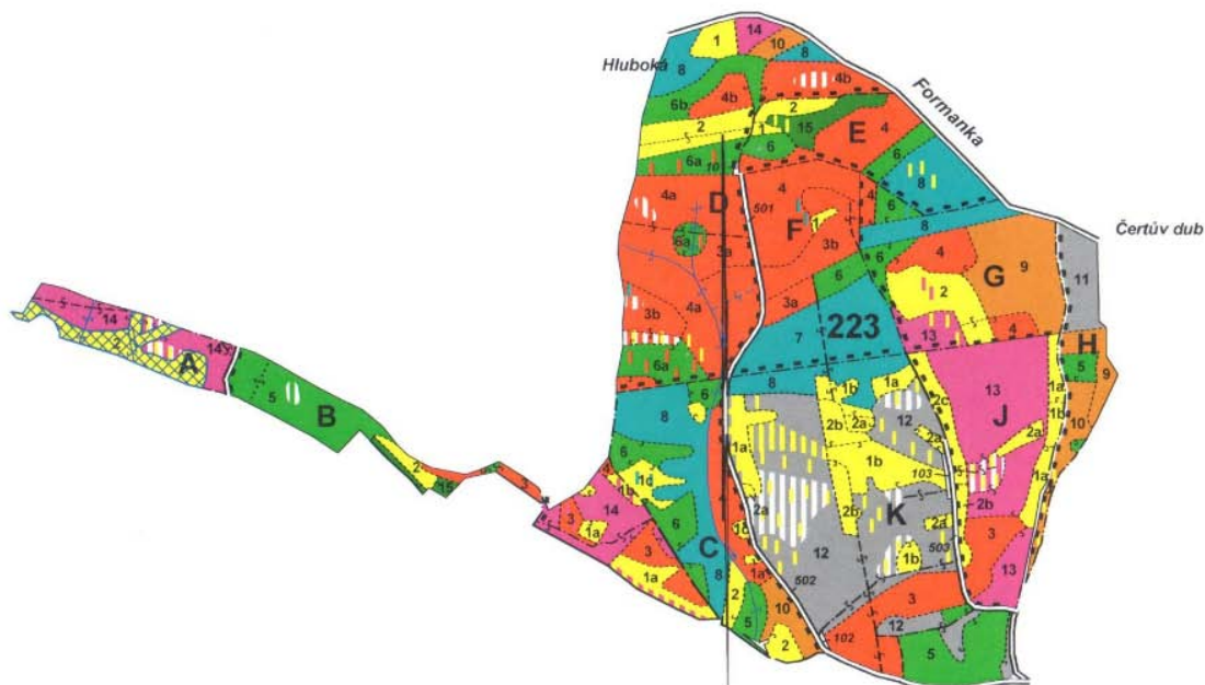
Mapa porostní DONH Sruby (LHP s platností od 1.1.2018)