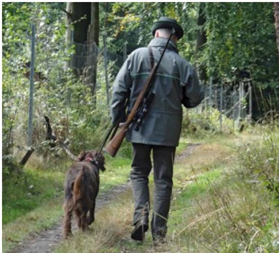
Myslivkyňe a myslivci se angažují za původní zvěř.

Protože se zvěř pohybuje volně, a přitom přes hranice honiteb, je smysluplné, aby se myslivci pro blaho zvěře a jejich biotopů dohodli na lovu a péči o zvěř. K tomu se mohou například organizovat do společenství péče o zvěř a společně s vlastníky pozemků a hospodáři vyvíjet a realizovat smysluplné strategie péče o zvěř. Ve Svobodném státě Sasko existuje více než 30 těchto dobrovolných společenství. Tyto provádějí společně například opatření péče o zvěř, vypracovávají speciální plány péče pro ohrožené druhy zvěře a spolupůsobí při monitoringu zvěře. Ve společenstvích péče o zvěř mají být navíc navzájem odsouhlasovány návrhy plánů lovu pro jednotlivé honitby, odhadnuta situace škod zvěří, mají být organizovány cvičné střelby, organizovány a prováděny společné lovy, zpracovány koncepty krmení zvěře a prováděny přehlídky trofejí.