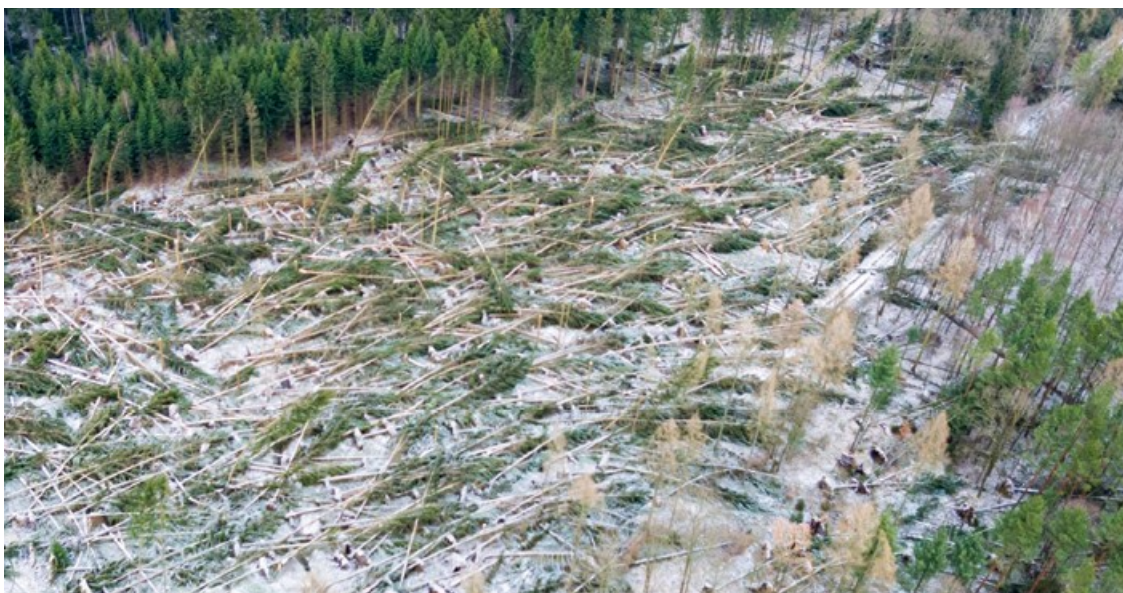
Stejnověké smrkové lesy těžko odolávají extrémním povětrnostním událostem - vichrům.