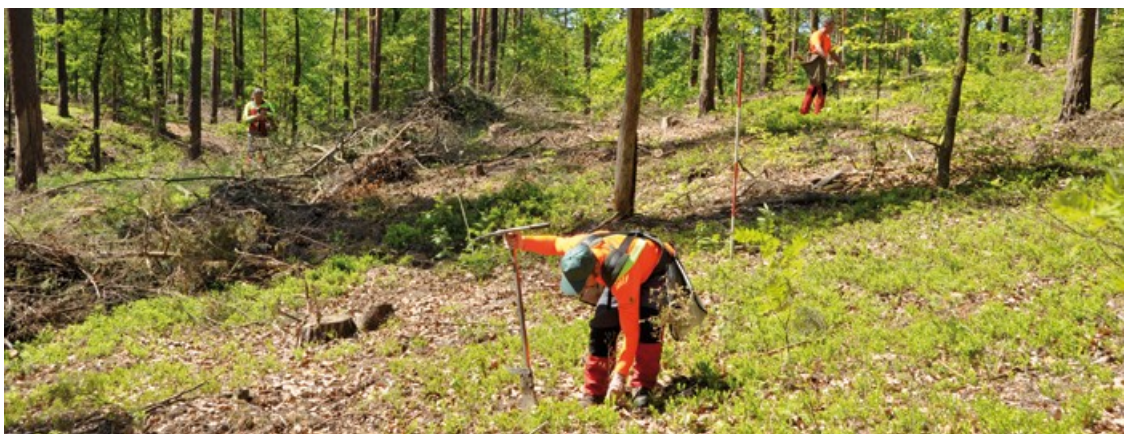
Lesníci zakládají sázením mladých stromů budoucí generaci lesa

Investiční objem Saska do generačního projektu přestavba lesa je pouze ve státních lesích průměrně kolem 15 milionů Euro ročně. A to se vyplatí: Saský les se tím stává zdravějším, stabilnějším a hodnotnějším. To slouží za prvé dnes žijícím lidem, a zároveň jsou tím naplňovány povinnosti vůči následným generacím. Protože i ty budou potřebovat nepoškozené a mnoha různými způsoby využitelné lesní ekosystémy.