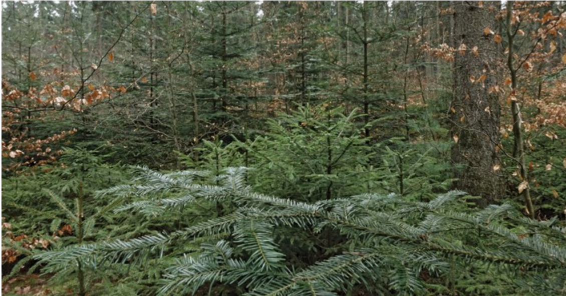
Pěstební cíl ve státním lese jsou stanovištně odpovídající, strukturálně bohaté smíšené lesy.