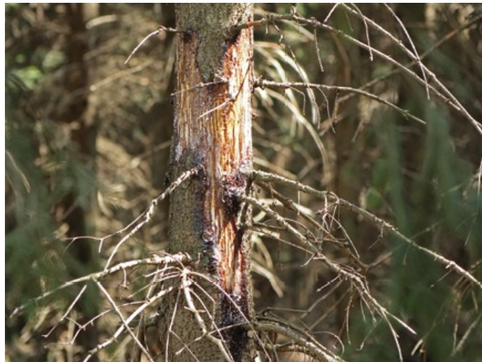
vlevo: zkousaný hlavní výhon mladého buku; vpravo: Škody loupáním na smrku