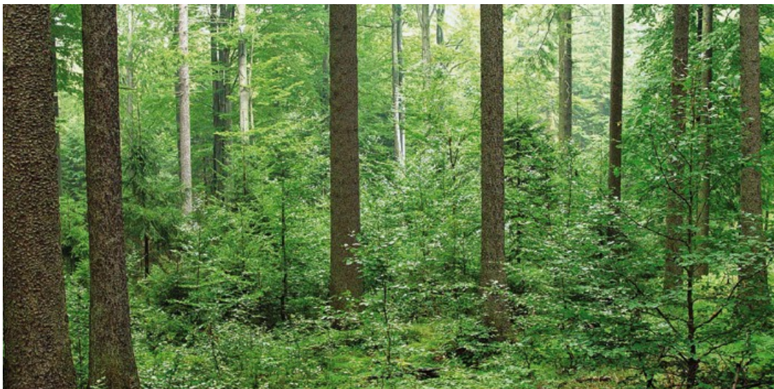
Smíšený les z buků a smrků – různé dřeviny a různý věk případně výška stromů podmiňují rozmanité struktury.

Probíhající klimatická změna přináší teplejší a sušší léta, regionálně nižší srážky a vyšší četnost extrémů počasí. Tím dále rostou výzvy pro lesy. Preferují se proto smíšené lesy s dřevinami, které jsou lépe přizpůsobeny předpokládaným klimatickým podmínkám. Řešit tento problém je úkolem přestavby lesa.