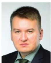
Mgr. Patrik Mlynář, náměstek ministra zemědělství pro řízení sekce lesního hospo- dářství

Zákon o myslivosti z roku 2001, který vznikl jako poslanecká iniciativa, předal kompetence do rukou vlastníků honebních pozemků s tím, že pokud jde o společensvé honitbu, platí při rozhodování demokratický princip – názor většiny.