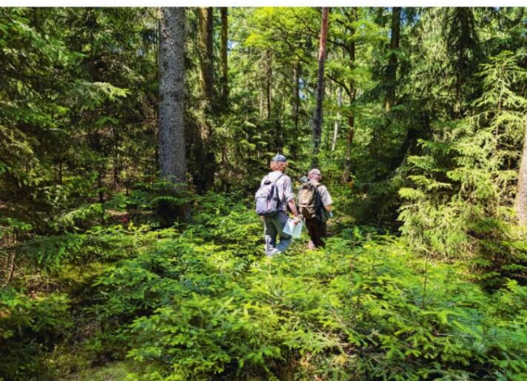
Díky dobré spolupráci s myslivci zde přirozená obnova prosperuje bez nutnosti oplocování či nátěrů.

Máte pravdu, bez lidí to nejde. Ano, daří. Těžba dříví probíhá výhradně vlastními zaměstnanci. Lesnický úsek