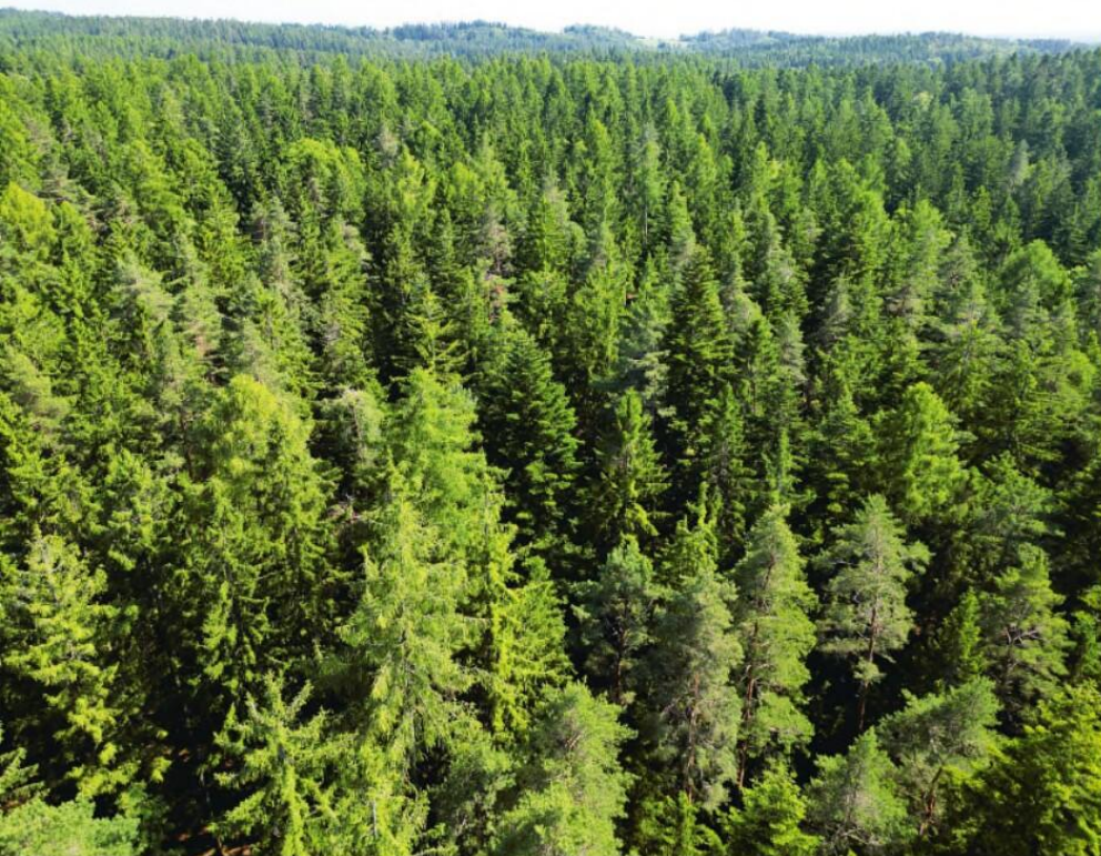
Výběrné lesy Klokočné po 35 letech přestavby.

úsudcích bez snahy a zájmu o provozní odzkoušení.