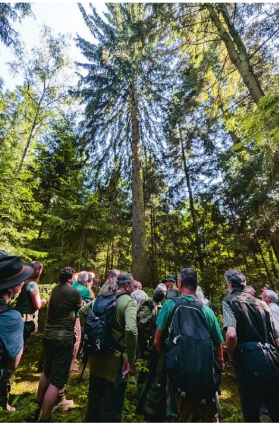
Desetikubíkový reprezentant smrku ve své plné životní kvalitě je cílovou zastávkou seminářů na Klokočné.

představuje stálé živobytí pro jednoho dřevorubce, a toho tu našťestí máme. Blokově na větší objemy prací jsou k dispozici traktory a několik harvesterových uzlů. Všichni do jednoho umí udělat znamení-tou práci.